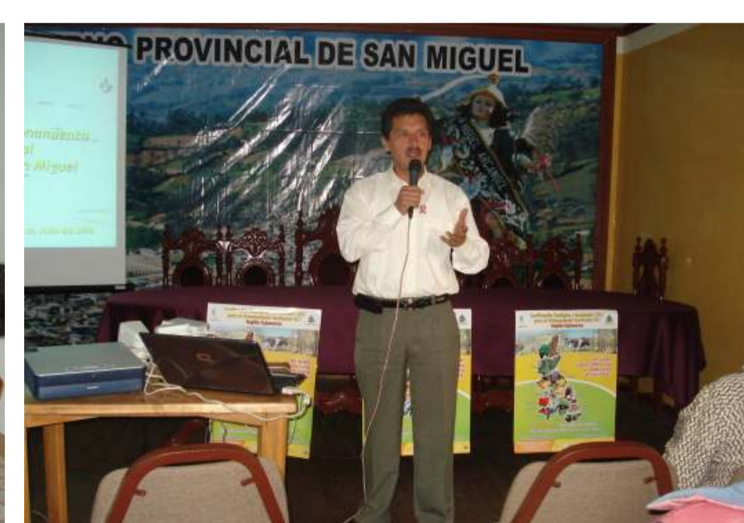
Técnico de Municipalidad de San Miguel expone sobre el Proceso