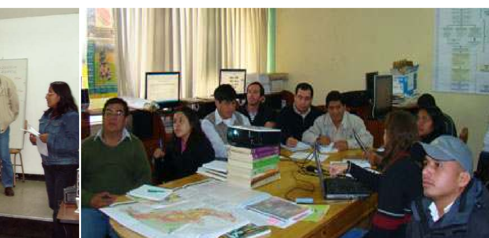
Equipo Técnico reconfirmado en marzo del 2008