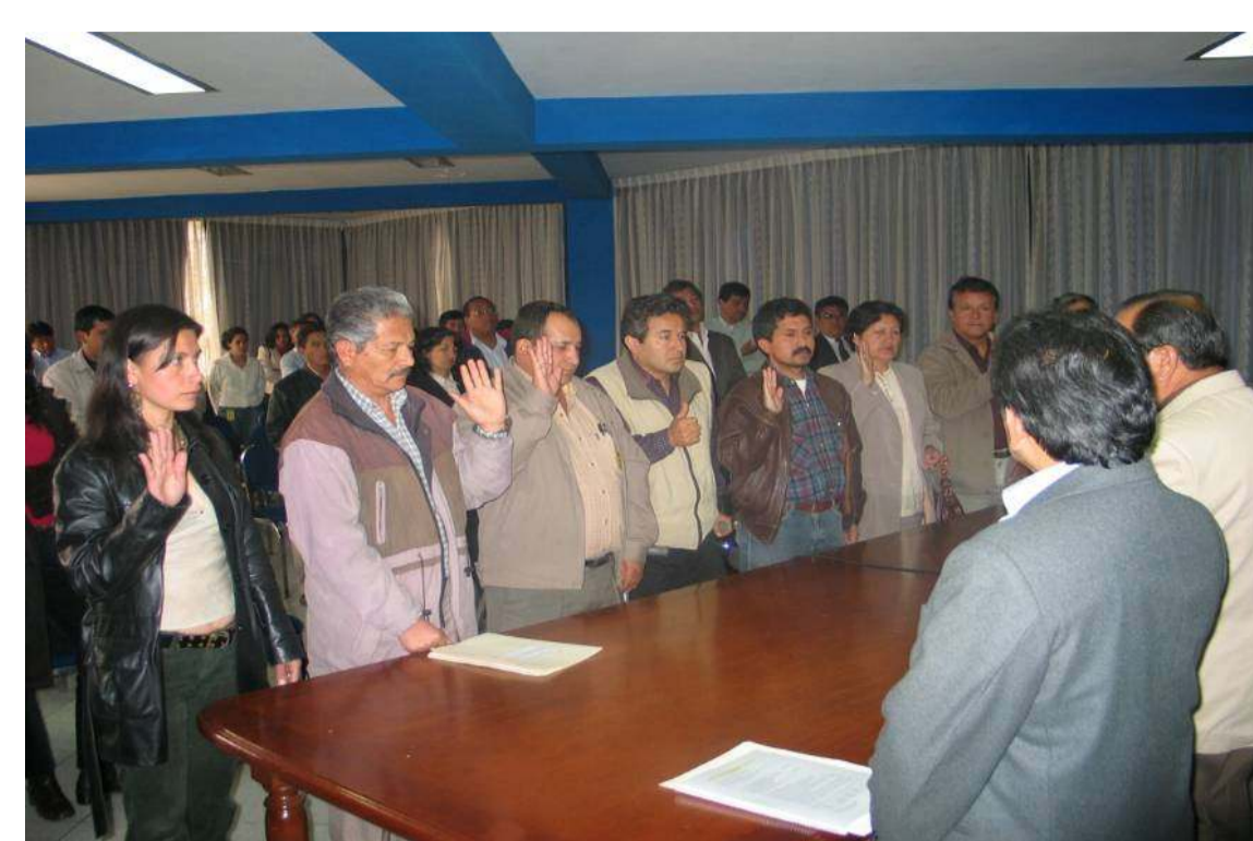
Representantes de las 13 provincias durante su juramentación