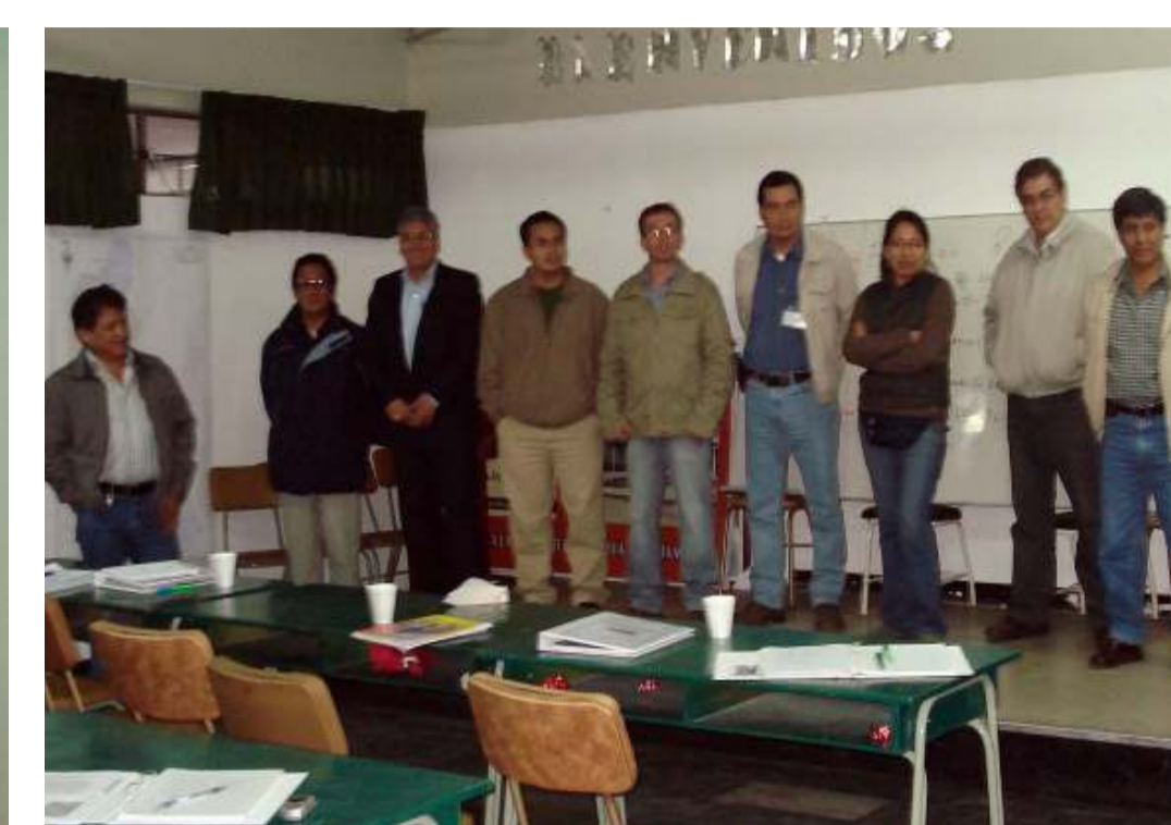
El Equipo Técnico conformado septiembre del 2007