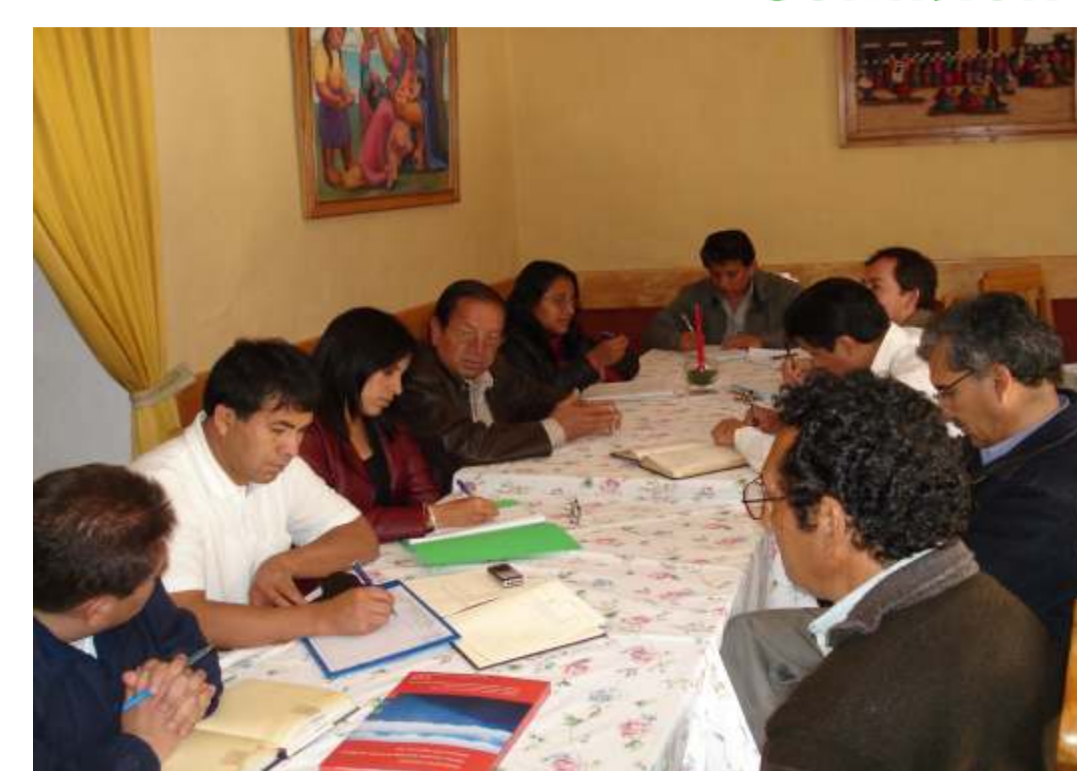
Reunión de Trabajo