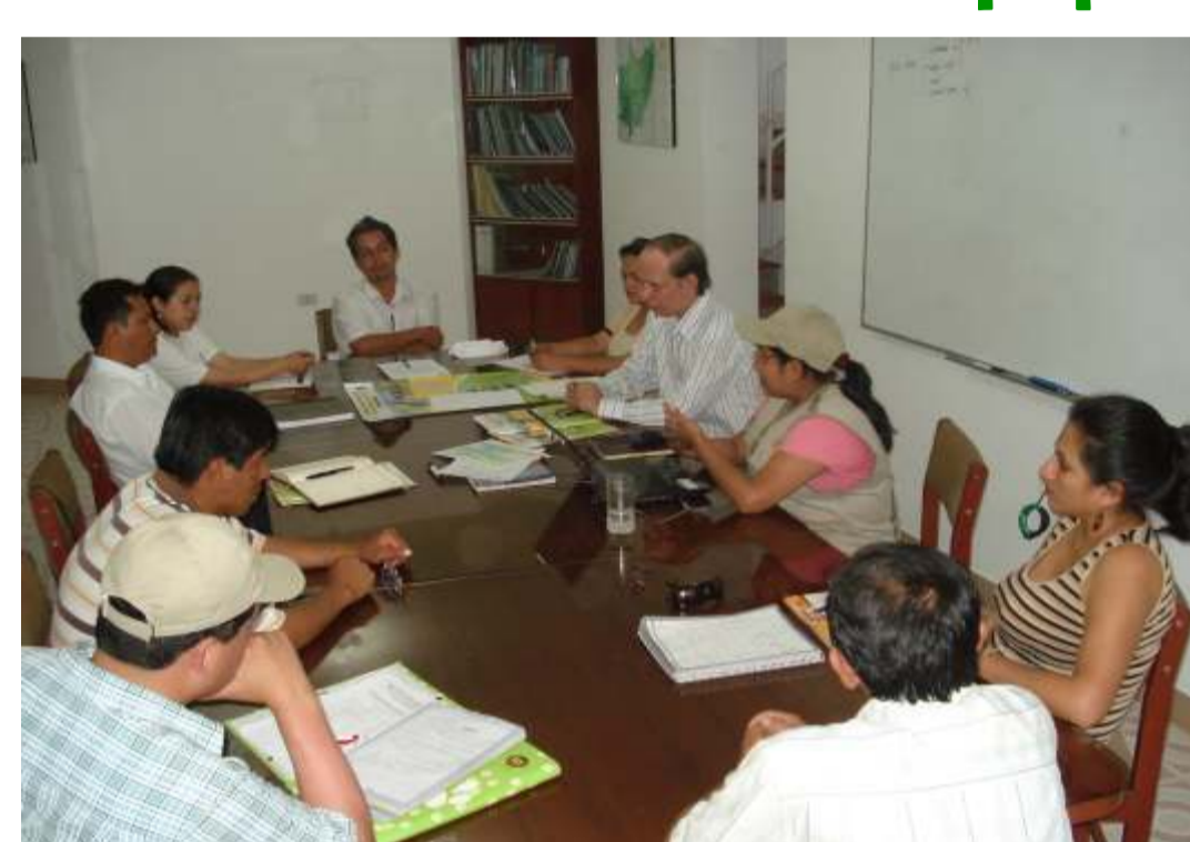
Reunión con Equipo Técnico de Jaén