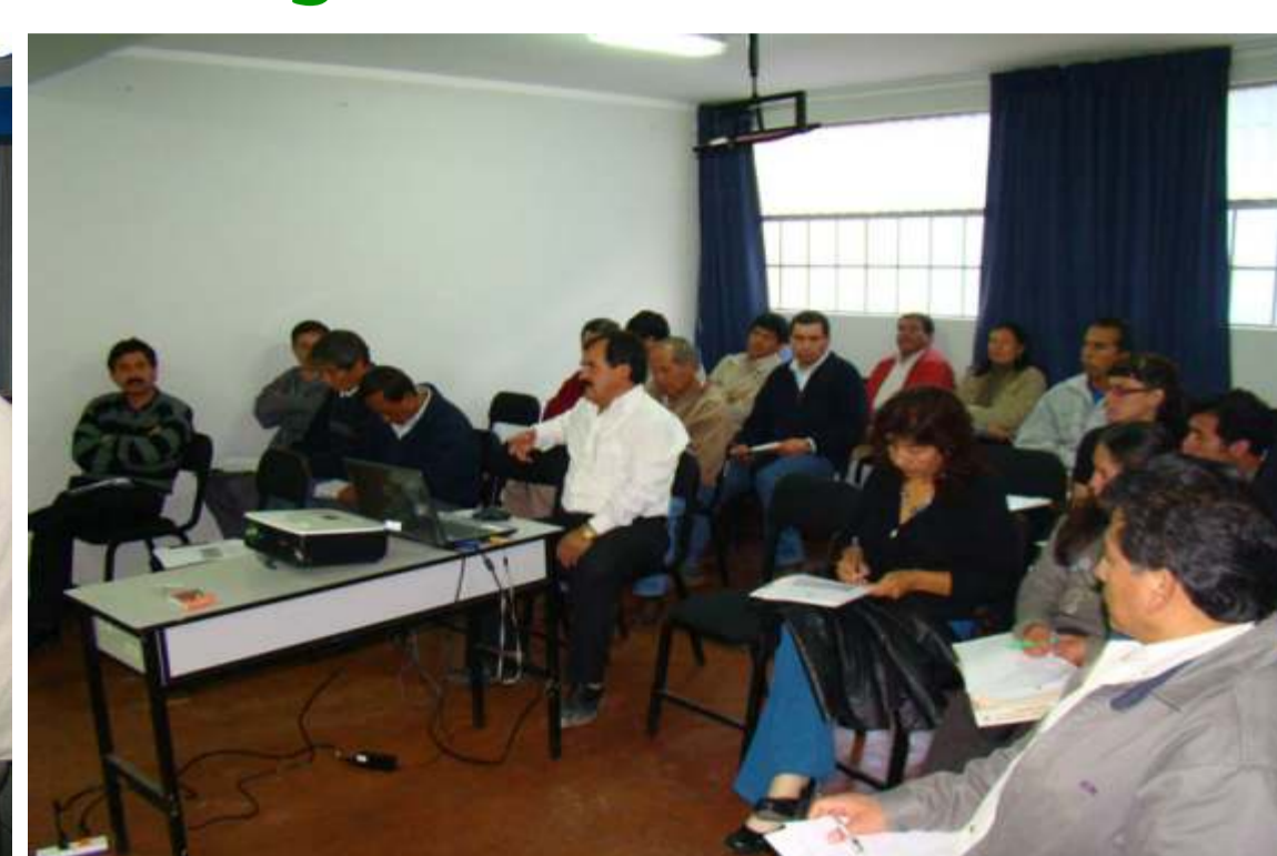
Reunión de Trabajo