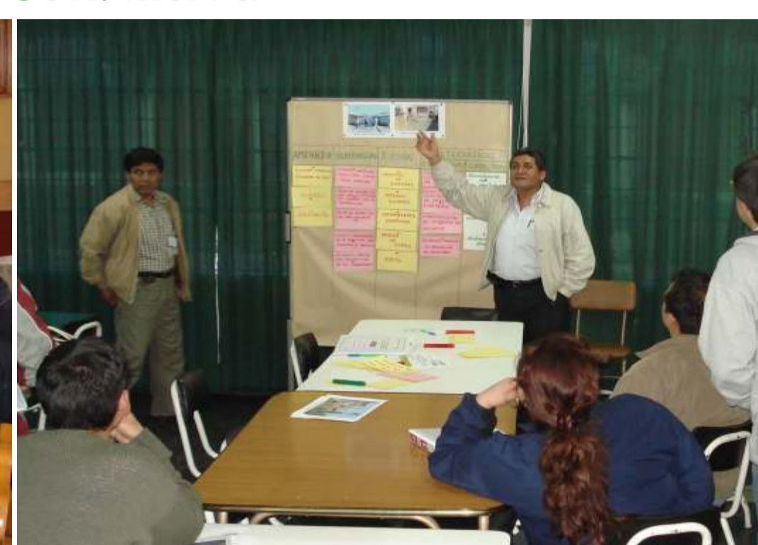
Capacitación apoyada por GTZ