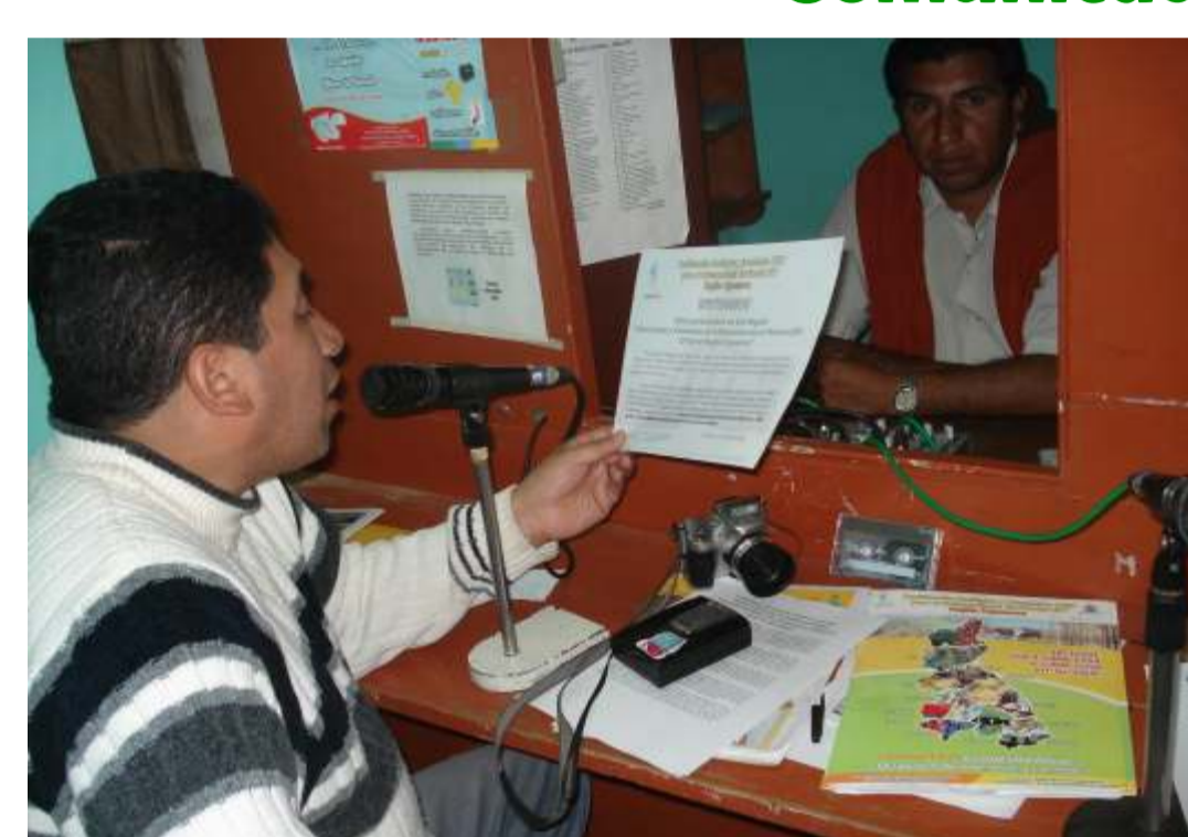
Comunicador de San Miguel, difunde el proceso a través del medio radial