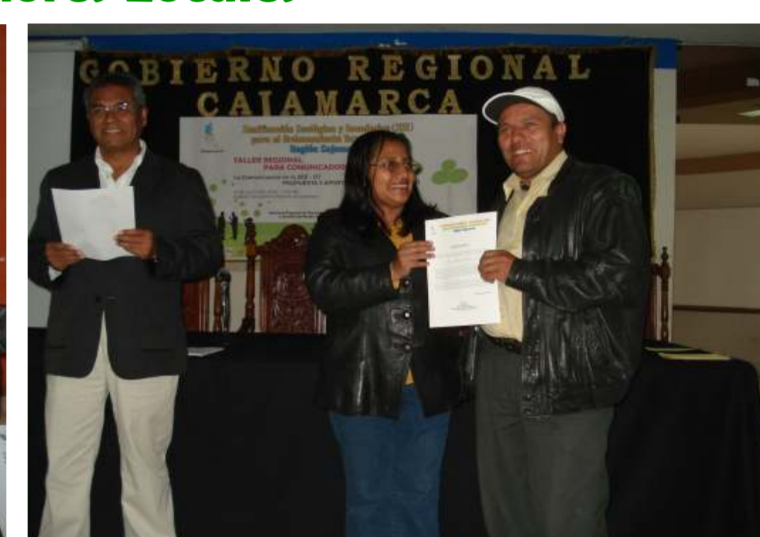
Comunicador de San Marcos, recibe certificado en Taller para Comunicadores Locales