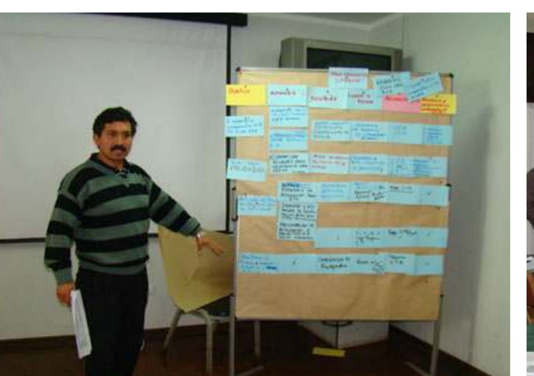
Talleres de Trabajo, de apoyo al proceso