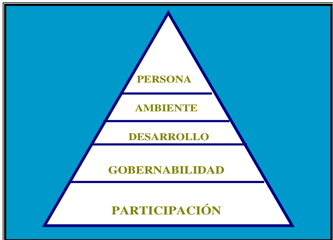
FIGURA Nº 01: EJES PARA EL PROCESO DE ORDENAMIENTO TERRITORIAL DE CARA UN DESARROLLO SOSTENIDO DE LA REGION.